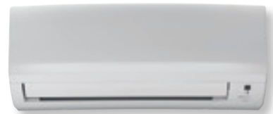
Tailles 20 à 35 : façade blanc mat